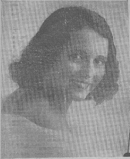
Doña CARMEN DE LOYNAZ DEL CASTILLO

que se celebrará el 25 de los corrientes. HEREDIA, Mayo de 1935.