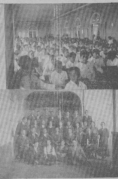
Arriba, un aspecto general del salón de actos del Instituto. Abajo: el personal del colegio y los festejados posan para DIARIO DE COSTA RICA.

La Fiesta de Ayer en el Instituto de Alajuela. Asistieron el secretario de Educación, la Misión Pedagógica Chilena y numerosas personalidades. Muy lucidos todos los actos del programa. — En el match de futbol y en el de basket, ganó el Instituto. DON RICARDO ENVIA UN TELEGRAMA DE FELICITACION